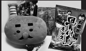
骨付鳥チップス、じゅうじゅうグッズ等