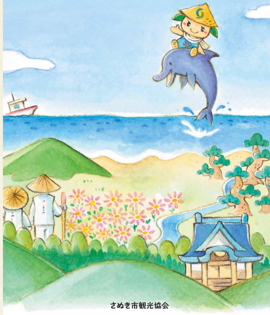
さめき市観光協会