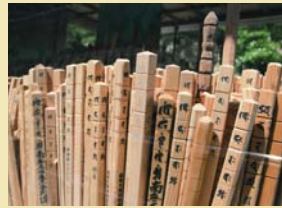
88番札所を巡り終えた金剛杖が納められている。

四国遍路を締めくくる結願の寺、大窪寺。標高774メートルの女体山のふもとにあり、本堂とそれに続く二重多宝塔が静かなたたずまいを見せています。境内にある寶杖堂には、無事に長旅を終えたお遍路さんたちの金剛杖が奉納されており、大護摩により供養されます。また、鐘の音とお遍路さんの鈴の音で環境庁（現在の環境省）主催の「百風景100選」に選ばれており、一年を通じて大勢の参拝客が訪れています。