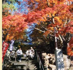
紅葉も見事な大窪寺