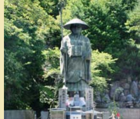
弘法大使を迎えてくれます。