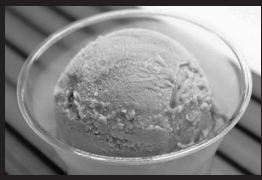
ぶどうアイス、ドリンク類他