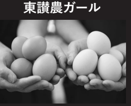
採れたて卵、スイーツ、野菜等