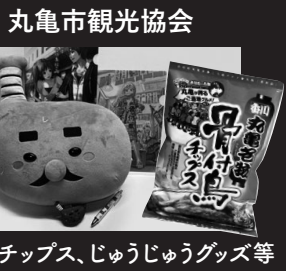
骨付鳥チップス、じゅうじゅうグッズ等