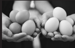
採れたて卵、スイーツ、野菜等