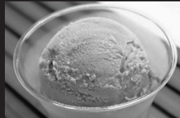
ぶどうアイス、ドリンク類他