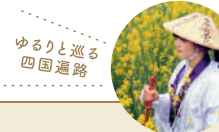
ゆるりと巡る四国遍路