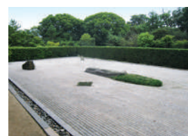
玉取り伝説を表現した枯山水式の無染庭。

住所：さぬき市志度1102 電話：087-894-0086 アクセス：さぬき市コミュニティバスでJR志度駅前から徒歩約10分、国道口から徒歩約5分 駐車場：有