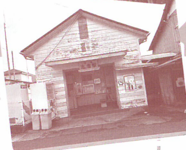
SHIDO MACHIBURA TANKENTAI SHIDO