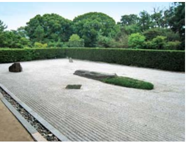
●アクセス：さぬき市コミュニティバスJR志度駅前から徒歩約10分、国道口から徒歩約5分 TEL.087-894-0086 (さぬき市志度1102)

仏の供養、健康祈願、精神鍛錬、自分探し…お遍路の目的やスタイルは実に様々です。お遍路の旅を締めくくると結願所大窪寺を含む「東讃五大寺まいり」はいかがでしょう。半分旅気分、半分お遍路気分、五大寺まいりに出かけてその土地の景色・食・文化などを体験する。ゆつくり、のんびり五か寺参りに出かけてみれば、ただの旅では出会えない四国遍路の醍醐味を心と体で感じる旅に出会えるでしょう。