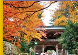
88 大窪寺 Okuboji