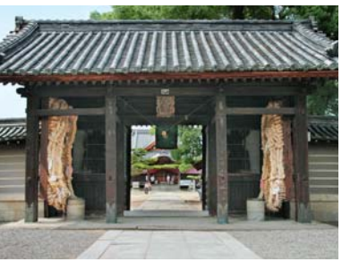
●アクセス：さぬき市コミュニティバス大川バス本社前から徒歩約5分 TEL.0879-52-2041 (さぬき市長尾西653)