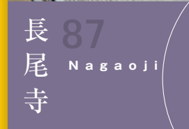
87 長尾寺 Nagaoji