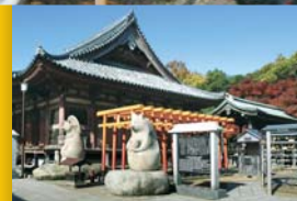
84 屋島寺 Yashimaji