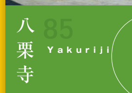
85 八栗寺 Yakuriji