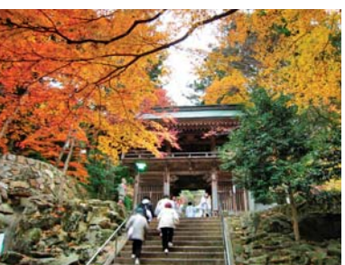
●アクセス：さぬき市コミュニティバス大窪寺から徒歩約1分 TEL.0879-56-2278 (さぬき市多和兼割96)