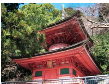
●アクセス：こつでん八栗駅から八栗ケーブル登山口駅まで徒歩約20分、山上駅まで約4分 TEL.087-845-9603 (高松市牟礼町牟礼3416)