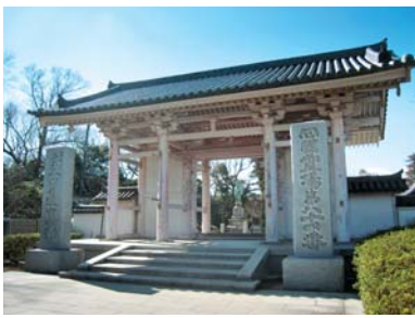
●アクセス：こつでんバス屋島山上大駐車場から徒歩約5分 TEL.087-841-9418 (高松市屋島東町1808)