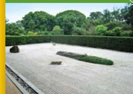
86 志度寺 Shidoji